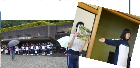
保護者の皆様もご参加ありがとうございました。

中学生は、総体に向けて頑張っています。6月5・6日は新居浜市総合体育大会です。3年生は、2年2ヶ月の練習の成果をしっかりと出しましょう。また、団体戦、個人戦ともに別子中学生らしい爽やかなプレーで臨みましょう。保護者の皆様も応援よろしくお願いいたします。