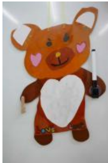
5年生「自画像」と立体「くまちゃんホワイトボード」

えひめこども美術展で特選になった作品、4年生の「へちまをとったよ」です。今年度はコロナウイルス感染拡大防止のため、巡回展示が中止になったため、ホームページ上で紹介します。