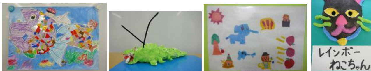
1年生「魚と遊んだよ」と立体の「わに」