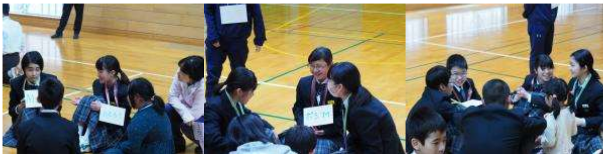
④気持ちをシェアリング（共有）