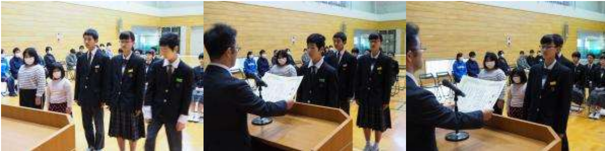
えひめっこピカイチ大賞