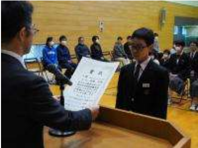
新居浜市小中学生科学奨励賞