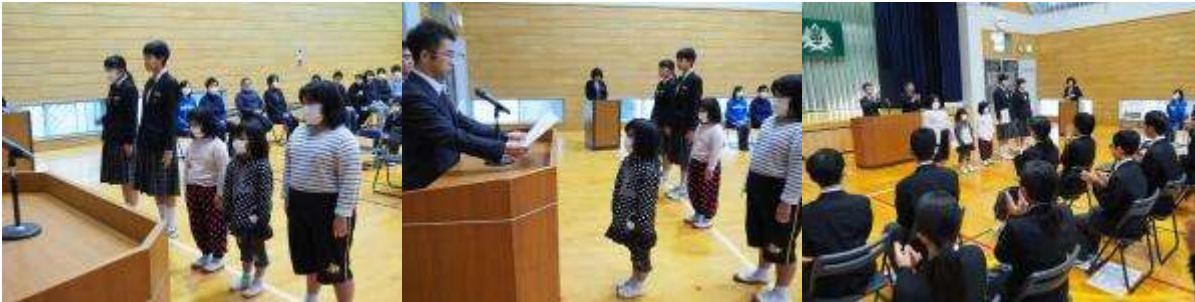
えひめこども美術展