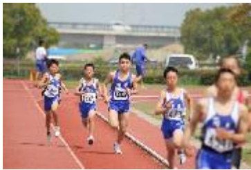
800m (左から3人目が駿くん)