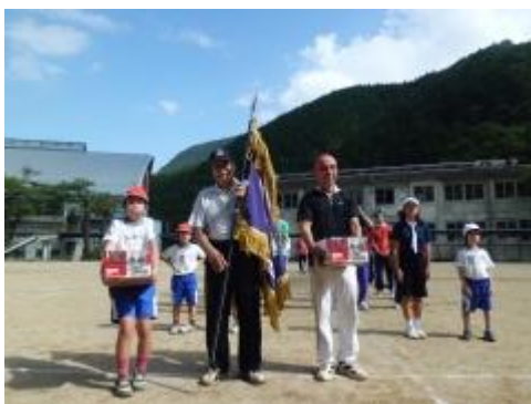
今年は、赤組の勝ちでした！