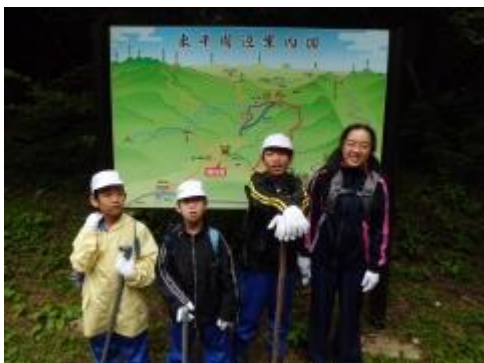
無事山を越えて、第3通洞まで下りてきました。みんな最後まで楽しく頑張れました。