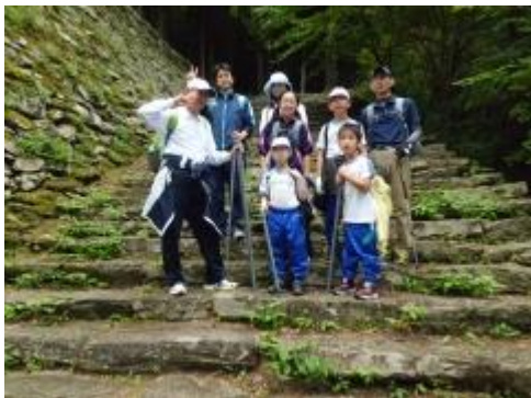
小足谷劇場跡への階段です。劇場でお芝居や映画を見てみたかったです！