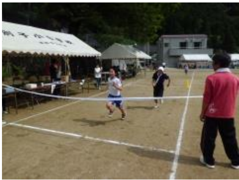
⑤運まかせ（さいころの色でコースが決まります。）