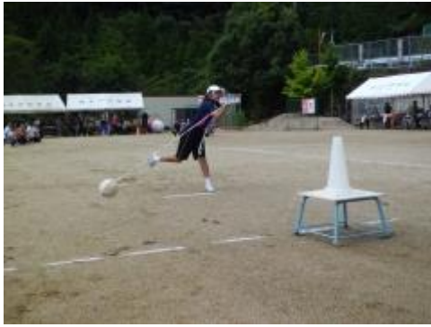
⑨ ボウリング (2人1組でボールを蹴ってそれぞれがビール瓶を倒します。)