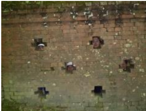
接待館跡です。レンガの穴から顔を出してにっこり～！