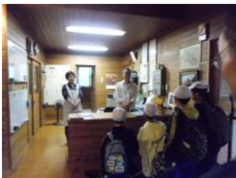
登山開始から5時間半、ようやく銅山の里自然の家に着きました。みんなで、「お願いします」の挨拶をしました。