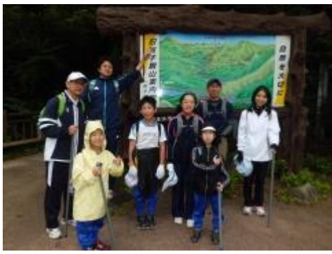
日浦の登山口です。さあ登山開始です。