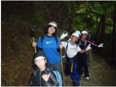
まずは、別子銅山の遺跡群へ向かいます。まだまだみんな元気いっぱいです。