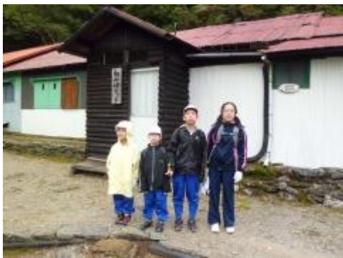
銅山峰ヒュッテに到着です。