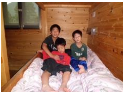
宿泊棟は、とってもきれいでした。ベッドメイキングも完了～！