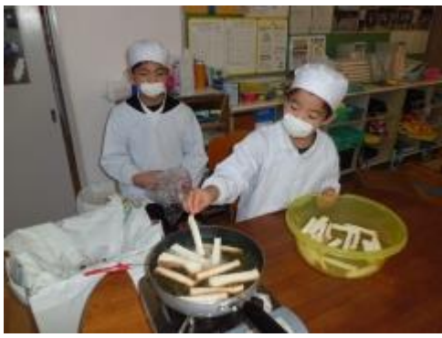
パンを油の中に投入～！