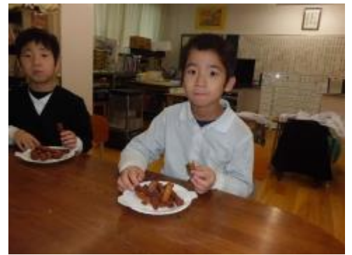
甘くて、さくさくしていて、とっても美味しかったです。