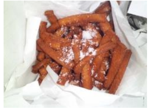
砂糖をかけます。砂糖が多めの方が美味しいです。