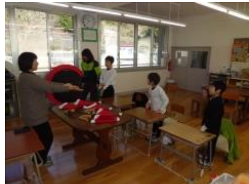
③プレゼントを渡す