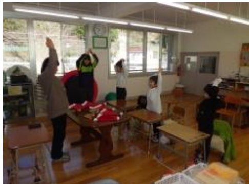
①クリスマスツリーポーズ ポーズ