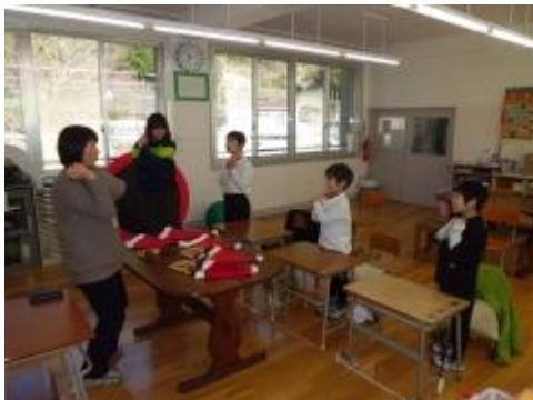
②プレゼントを運ぶポーズ