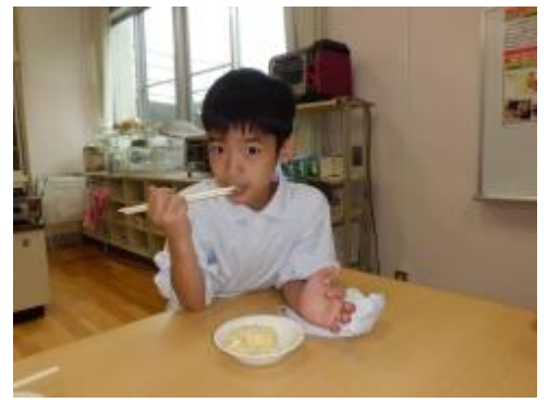
新じゃがで作ったポテトサラダはめっちゃうま！でした。