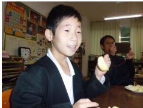
自分で皮をむいたリンゴは、とてもおいしかったです。