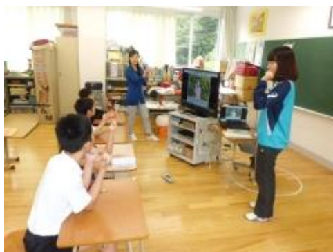
春菜（わか）先生の英語の時間です。英語で数を数える時の発音と指の折り方を勉強しました。