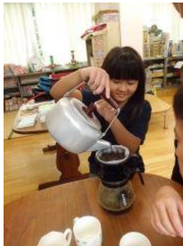
封を切ったばかりの豆だったので、教室中にとっても良い香りが広がりました。