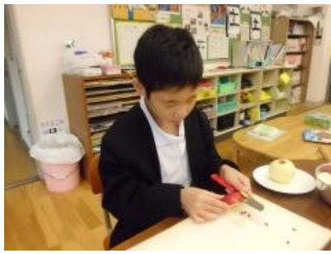
涼くんは、先に割ってからむく方法を勉強しました。