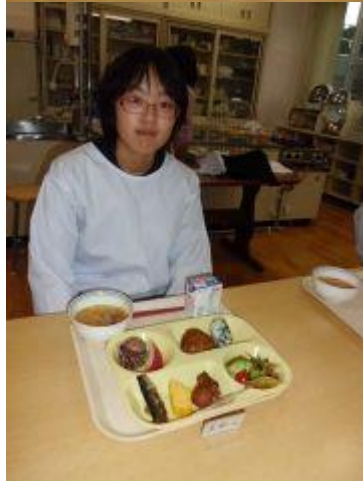
一人一人考えてトレイに取ることができました。